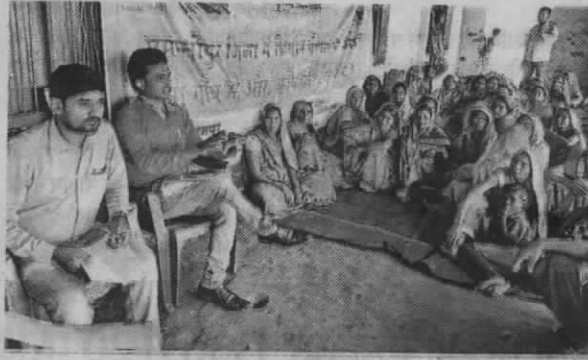
मोहनपुर में किसान चौपाल में मौजूद किसान व अधिकारी।