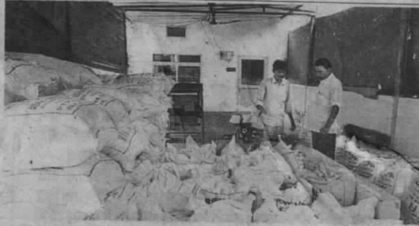
तैयार वर्मी कंपोस्ट को पैकिंग करते कर्मी

उत्पादन केंद्र स्थापित करने में करीब 50 लाख रुपये किए खर्च