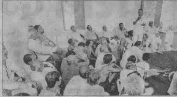
चौपाल में मौजूद किसान.