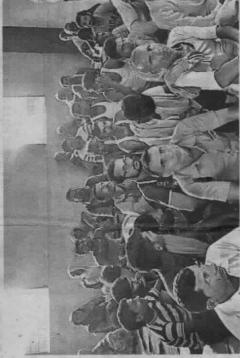
हसनपुर में खेती के तौर-तरीके सीखते किसान।