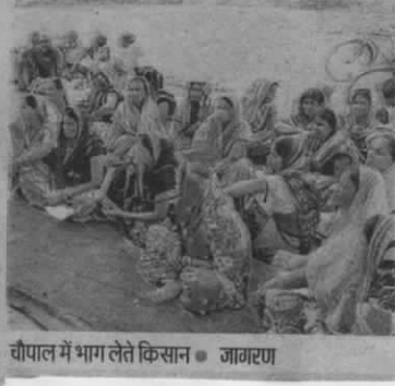
चौपाल में भाग लेते किसान