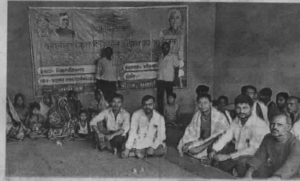
विद्यापतिनगर में सोठगामा पंचायत में किसान चौपाल में उपस्थित किसान।

मोहनपुर | प्रखंड के बघड़ा पंचायत के कबीरपंथी मठ में किसान चौपाल का आयोजन किया गया। कृषि