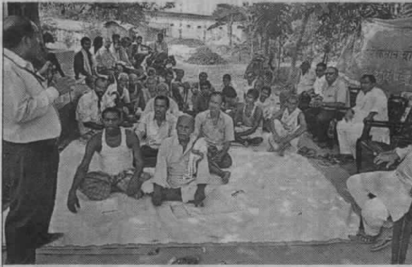
विद्यापतिनगर की बाजिदपुर पंचायत में किसान चौपाल में शामिल किसान।