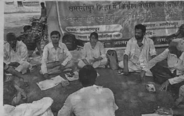
कल्याणपुर में किसानों को खेती की जानकारी देते कृषि समन्वयक।