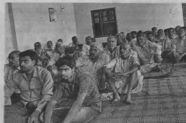
रोसड़ा में किसान चौपाल में उपस्थित किसान व ग्रामीण।